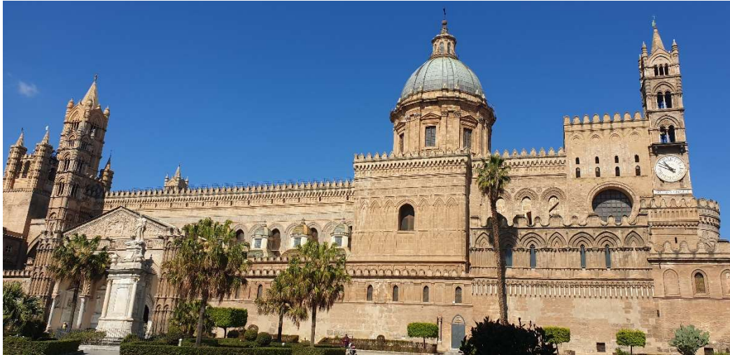
Catedral de Palermo

Dirigiéndonos hacia oeste, podrán descubrir el maravilloso monasterio benedictino de Monreale , el mayor edificio religioso de su época, construido en señal de triunfo sobre la religión islámica. El interior de la Catedral de Monreale es enteramente recubierto por mosaicos de oro .