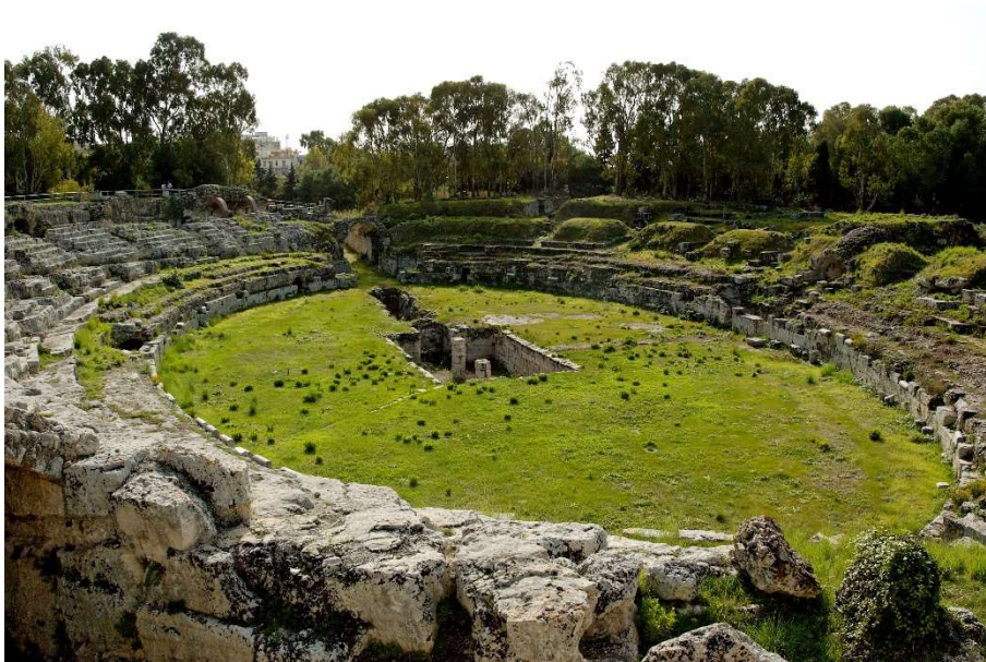
Teatro Griego de Siracusa